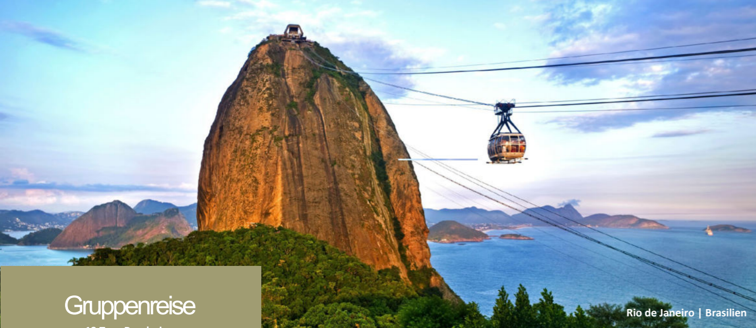
Rio de Janeiro | Brasilien