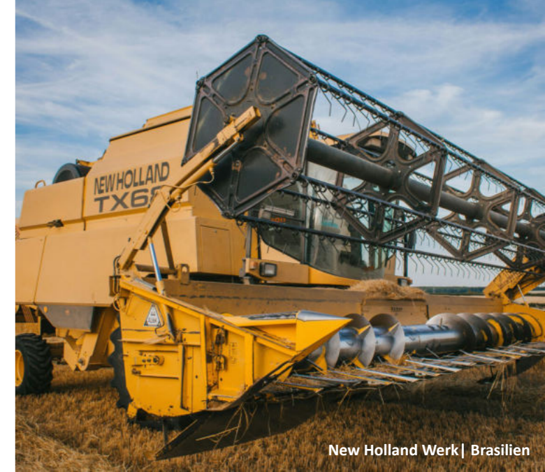
New Holland Werk | Brasilien